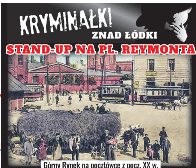
Górnym Rynku na pocztówce z pocz. XX w.

brycznym, wówczas pustym, przy ulicy Piotrkowskiej (dziś pl. Katedralny). Budowę rozpoczęto w 1842 r., a ukończono w grudniu 1845 r. Pierwszy łódzki szpital św. Aleksandra otwarto 1 stycznia 1846 r. w budynku, gdzie dziś po przebudowie znajduje się seminarium duchowne. Miasto stopniowo się rozwijało, a liczba ludności wzrosła w połowie XIX w. do kilkunastu tysięcy osób. Większość łodzian musiała odbywać także długą drogę po lekarstwa,