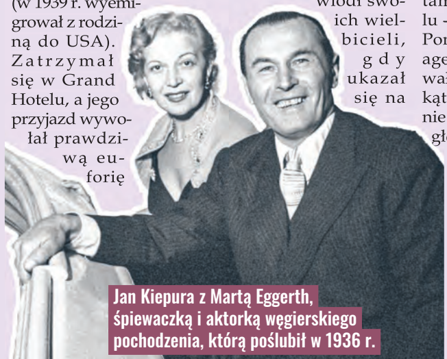
Jan Kiepura z Martą Eggerth, śpiewaczką i aktorką węgierskiego pochodzenia, którą poślubił w 1936 r.

z osobami towarzyszącymi też zajmował trzy-pokojowy apartament na II piętrze Grand Hotelu, a reporterowi łódzkiej gazety powiedział: „Ten las kominów przypomina mi moje rodzinne miasto Sosnowiec. Tam urodziłem się 26 lat temu, tam ukończyłem gimnazjum, tam odbył się mój pierwszy koncert”. Lista sławnych aktorów, wirtuozów, kompozytorów, piosenkarzy, którzy mieszkali w Grand Hotelu jest długa, ale chyba największy entuzjazm towarzyszył pobytowi śpiewaka operowego Jana Kiepury – idola opery, a także kina przedwojennej i powojennej publiczności na całym świecie. agr