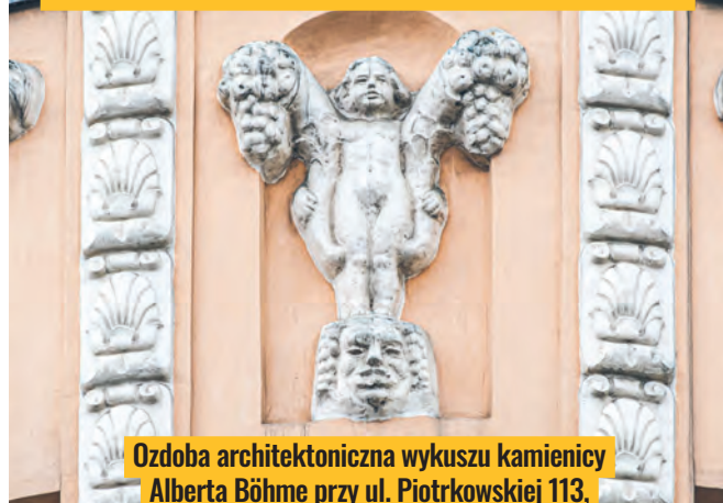
Ozdoba architektoniczna wykuszu kamienicy Alberta Böhme przy ul. Piotrkowskiej 113,

zbudowanej w latach 1911–1912 według projektu Romualda Müllera