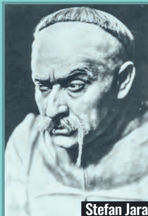
Stefan Jaracz w „Zemście” (Teatr Ateneum, 1930 r.)

W 1930 r. w Warszawie Jaracz założył własny Teatr Ateneum, który prowadził aż do wybuchu wojny, z przerwą w latach 1933–1935. W sezonie 1932/1933 aktor dzielił kierownictwo z Leonem Schillerem. Ateneum powstało jako popularny teatr dla mas o wysokim poziomie artystycznym, który miał krzewić kulturę wśród robotniczego środowiska, ale szybko stał się jedną z najmodniejszych scen stolicy, także dla warszawskiej