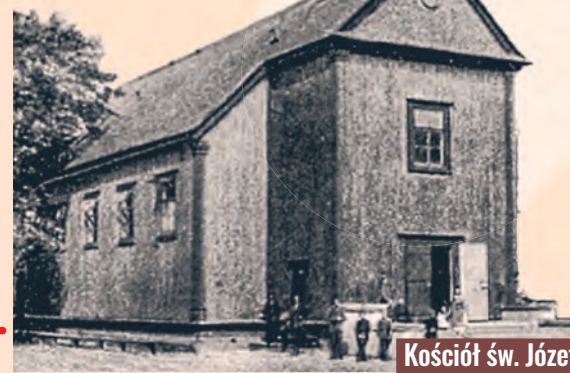
Kościół św. Józefa