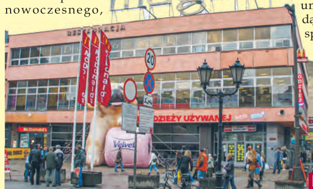
DH „Magda” w 2007 r.

Dom Handlowy „Magda”, mieszczący się w samym centrum, przyniósł na przełomie lat 60. i 70. XX w. powiew nowoczesnego,