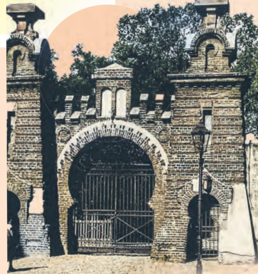
Brama cmentarza żydowskiego przy ul. Wesolej

W 1888 r. Bóznicy Dozór zwrócił się do władz z prośbą o powiększenie cmentarza lub założenie nowego, a diaspora żydowska w Łodzi liczyła już wówczas ok. 50 tys. osób. Nowy cmentarz żydowski przy ul. Brackiej powstał w 1892 r. agr