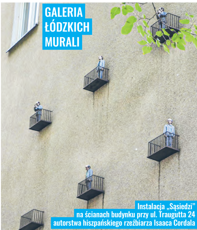
Instalacja „Sąsiedzi” na ścianach budynku przy ul. Traugutta 24 autorstwa hiszpańskiego rzeźbiarza Isaaca Cordala