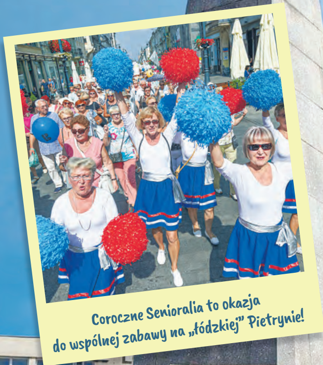
Coroczne Senioralia to okazja do wspólnej zabawy na „łódzkiej” Pietrynie!