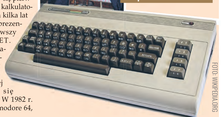
Jack Tramiel (Idek Trzmiel) i popularny w latach 80. komputer Commodore 64

uważany za najpopularniejszy w dziejach, a potem doszły jeszcze modele Atari, które otworzyły rynek gier. „Komputery dla mas, a nie dla klas...” – mawiał Tramiel, jeden z pionierów światowej branży komputerowej rodem z Łodzi. agr