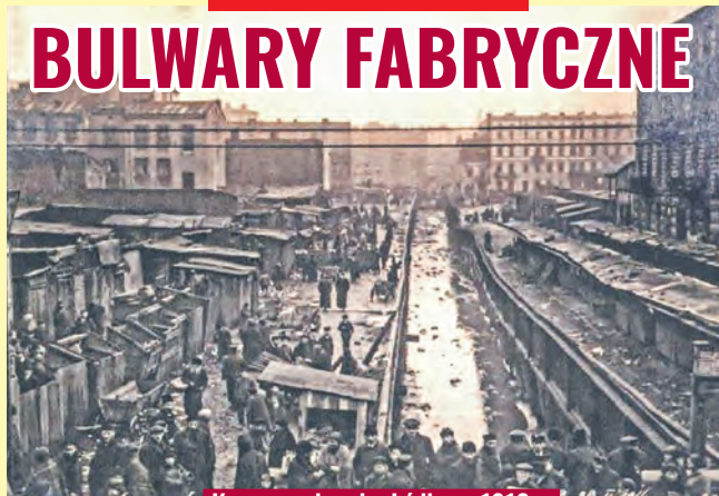
Kramy nad rzeką Łódką w 1916 r.

XIX wieku wzdłuż ulicy Północnej, w rejonie ulicy Franciszkańskiej obok farbiarni Biedermanna (stąd