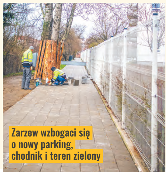
Zarzew wzbogaci się o nowy parking, chodnik i teren zielony

– Warunki atmosferyczne nam sprzyjają i zaczynamy kolejną inwestycję – mówi Mar-