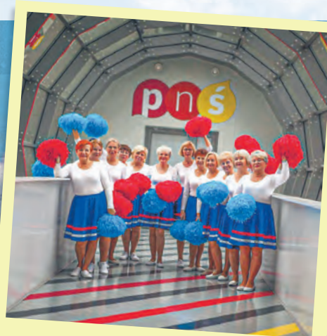
Łódzkie cheerleaderki wystąpiły w telewizji w programie „Pytanie na śniadanie”