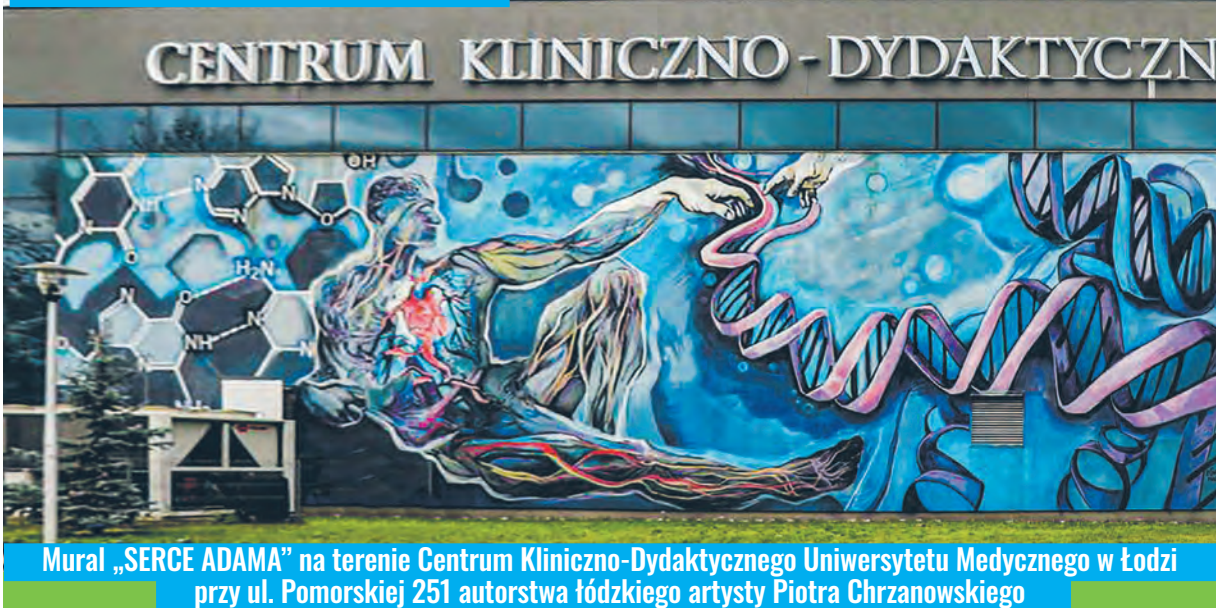
Mural „SERCE ADAMA” na terenie Centrum Kliniczno-Dydaktycznego Uniwersytetu Medycznego w Łodzi przy ul. Pomorskiej 251 autorstwa łódzkiego artysty Piotra Chrzanowskiego