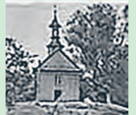
Kaplica św. Walentego