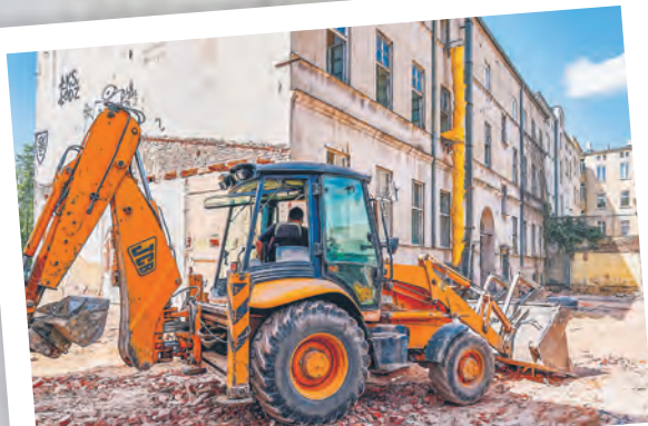
Prace remontowe budynku KIR już się rozpoczęły