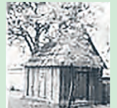
Tzw. domek św. o. Rafała

Nękaną ciężką pracą i złorzeczeniami pracodawcy majster modlił się, prosząc o pomoc św. Antoniego, aż pewnego razu święty mu się ukazał.