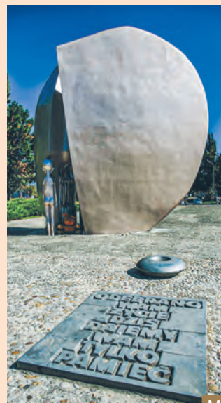
Pękniętego Serca wzniesiono na dawnym terenie obozu dla dzieci i młodzieży polskiej przy ul. Przemysłowej

11 XII 1942 r. przyjechał pierwszy transport, a do 18 I 1945 r. przeszło przez niego kilka tysięcy dzieci. Kilkuset małych więźniów zmarło z głodu, chorób i bicia. Wolności doczekało ok. 900 dzieci w stanie krańcowego wyczerpania. Pierwszą formą upamiętnienia ofiar obozu przy ul. Przemysłowej,