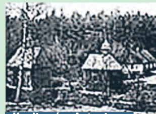
Kaplice św. Antoniego oraz św. Rocha i Sebastiana (istnieją do dziś)