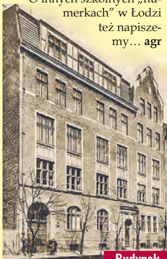
Budynek Gimnazjum im. M. Kopernika na przedwojennej pocztówce

O innych szkolnych „numerkach” w Łodzi też napiszemy... agr