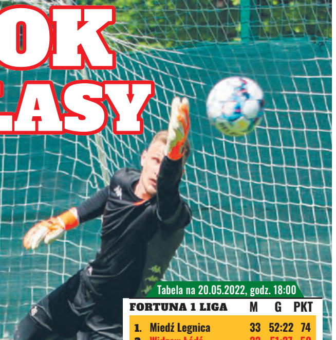
Tabela na 20.05.2022, godz. 18:00