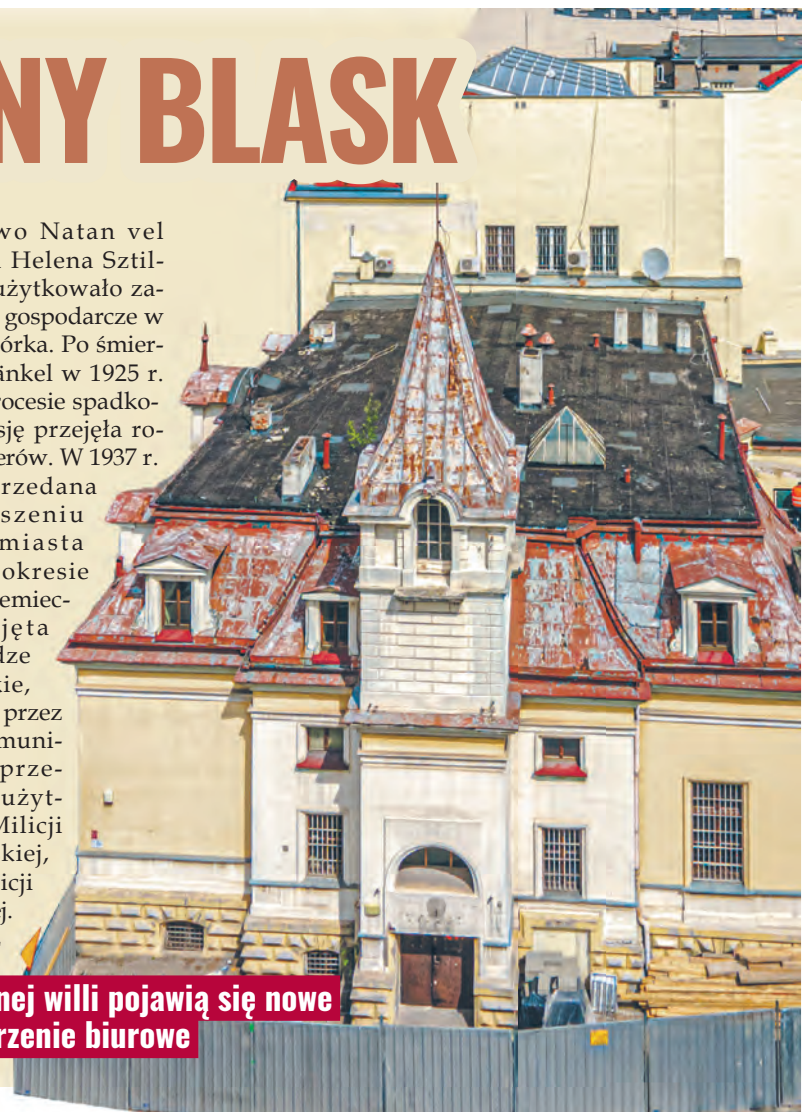
W dawnej willi pojawią się nowe przestrzenie biurowe