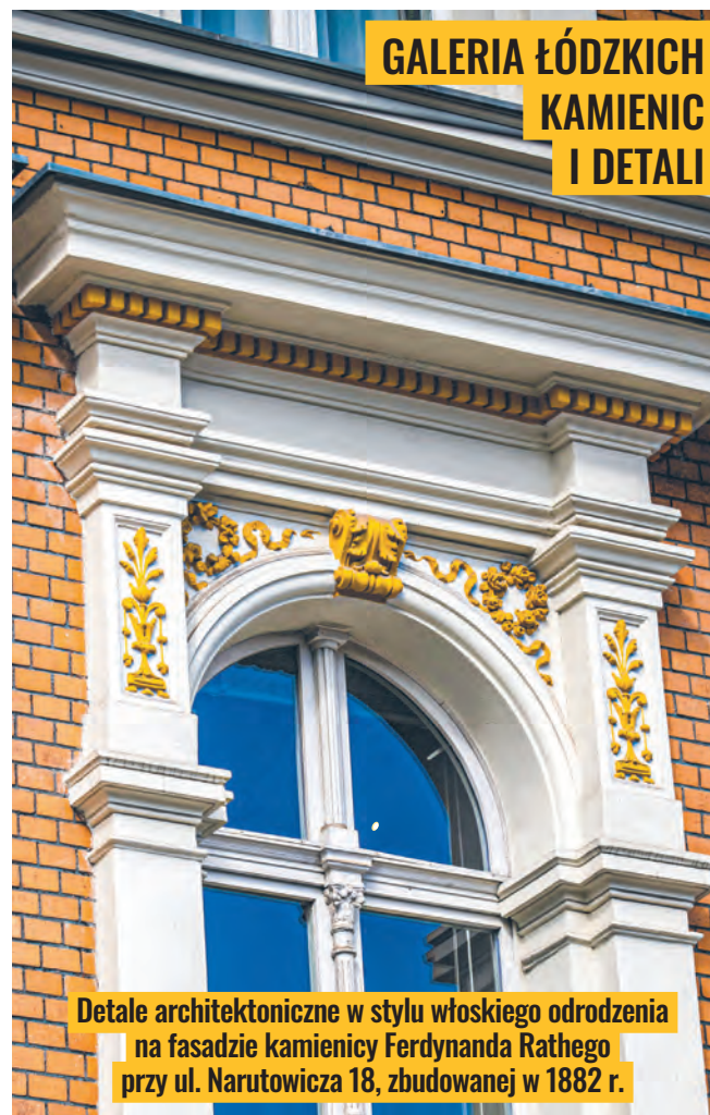
Detale architektoniczne w stylu włoskiego odrodzenia na fasadzie kamienicy Ferdynanda Rathego przy ul. Narutowicza 18, zbudowanej w 1882 r.