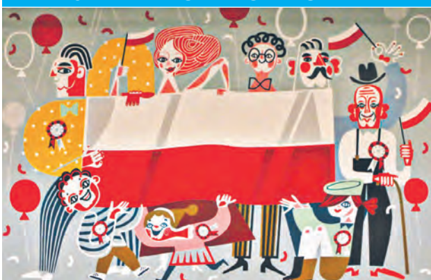
Mural patriotyczny z okazji Dnia Flagi we wnętrzu Dworca Łódź Fabryczna autorstwa Katarzyny Boguckiej