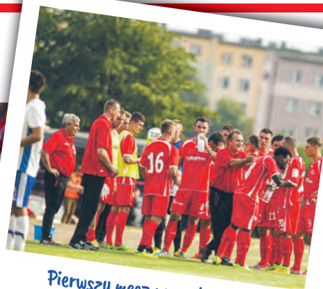
Pierwszy mecz po reaktywacji z Zawiszą Pajęczno