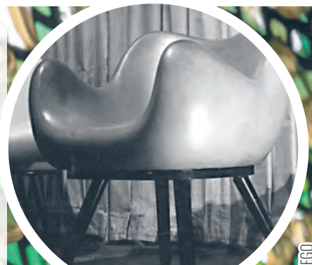
Kultowy Fotel RM 58