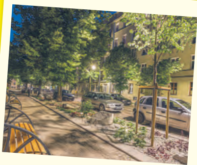
Woonerf ul. Zacisze