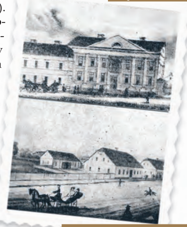
Ul. Piotrkowska 274-276, zdjęcie z lat 50. XIX w.

szynki, bawarie, traktiernie i restauracje, uzbiera się w połowie XIX w. ponad 70 różnego typu lokali, głównie przy ul. Piotrkowskiej. Rzecz jednak w tym, że Łódź miała wówczas zaledwie 15–20 tys. mieszkańców! Potem dopiero powstawały bardziej wykwintne i okazałe lokale, miejsca niemal kultowe, także z ogródkami i innymi atrakcjami, o których napiszemy za tydzień.