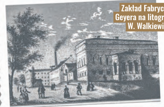
Zakład Fabryczny Geyera na litografii W. Walkiewicza