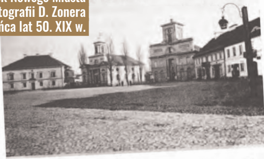
Rynek Nowego Miasta na fotografii D. Zonera z końca lat 50. XIX w.

Łódź progu XXI wieku szczyła się ulicą Piotrkowską pełną pubów, klubów i restauracji, odżyły kawiarniane ogródki na głównej ulicy miasta. Tak jest nadal, ale warto przypomnieć, że mamy w tym względzie bogate tradycje sięgające połowy XIX wieku!