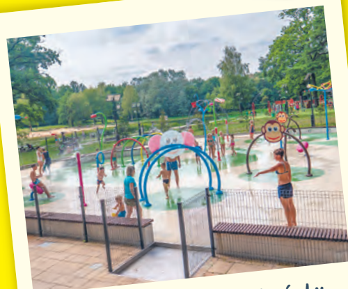
Wodny plac zabaw w Arturówku