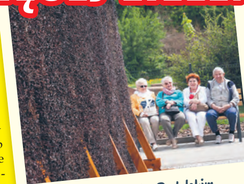
Tężnia w parku Podolskim