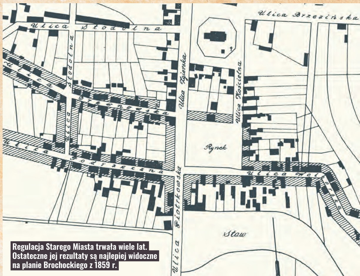
Regulacja Starego Miasta trwała wiele lat. Ostateczne jej rezultaty są najlepiej widoczne na planie Brochockiego z 1859 r.