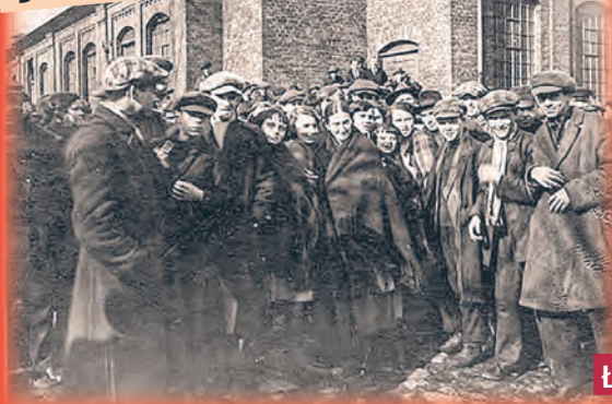
Łódzka robociarska brać

a dodatkowo fabrykant wprowadził nakaz pracy w dni świąteczne. Miało to obowiązywać od 15 sierpnia, czyli święta Matki Boskiej Zielnej. Złamanie nakazu kosztowało pracownika do 3 rubli. Protestujących spacyfikowała policja i sotnia Kozaków, zwolniono 50 osób. W 1891 r. pełnomocnik inspektora fabrycznego meldował, że w fabryce Poznańskiego płaci się najmniej w Łodzi, a kary spotykające tkaczy są najwyższe. Choroby płuc powstające w wyniku zanieczyszczenia powietrza przędzą byty normą. I chociaż Poznański wypłacał świadczenia pracownikom, którzy doznali uszczerbku na zdrowiu, a także inwestował w domy robotnicze, nie miał w Łodzi dobrej opinii i uchodził za bezwzględnego pracodawcę. agr