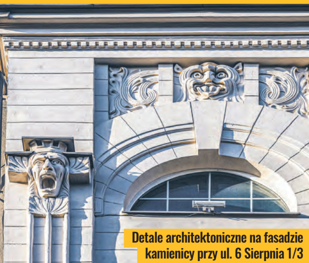
Detale architektoniczne na fasadzie kamienicy przy ul. 6 Sierpnia 1/3