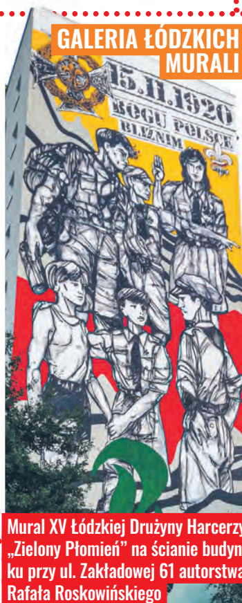
Mural XV Łódzkiej Drużyny Harcerzy „Zielony Płomień” na ścianie budynku przy ul. Zakładowej 61 autorstwa Rafała Roskowińskiego