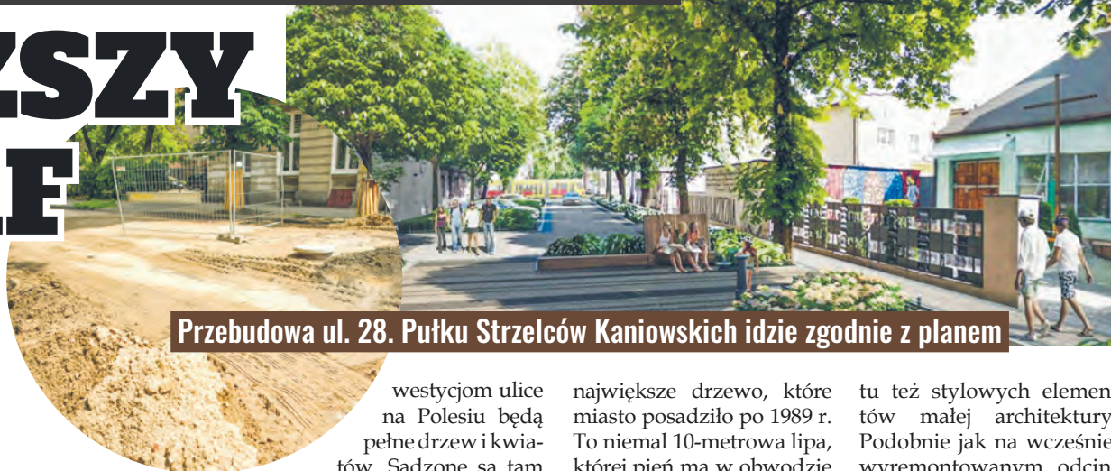
Przebudowa ul. 28. Pułku Strzelców Kaniowskich idzie zgodnie z planem