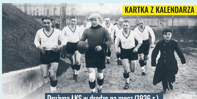
KARTKA Z KALENDARZA

wych, w skład której wchodziła koszykówka, siatkówka oraz hazena. Wkrótce powstały kolejne sekcje: boks, kolarstwo, pływanie. ŁKS to 23-krotny mistrz Polski w sportach drużynowych, a indywidualnie elkaesiacy 6-krotnie zdobywali medale na igrzyskach olimpijskich oraz kilkakrotnie w różnych dyscyplinach na mistrzostwach Europy i świata. Dwudziestolecie międzywojenne przyniosło szereg sukcesów w grach zespołowych. W latach 1929–1933 ŁKS zdominował niemal wszystkie rozgrywki