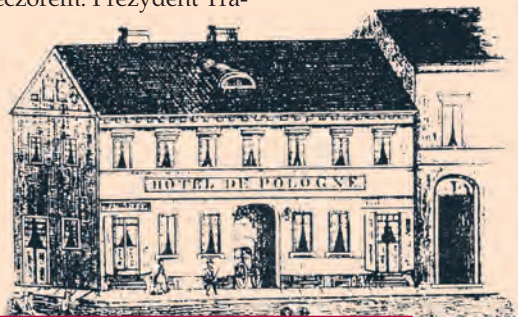
Pierwszy łódzki zajazd, czyli Hotel Polski przy ul. Piotrkowskiej 3