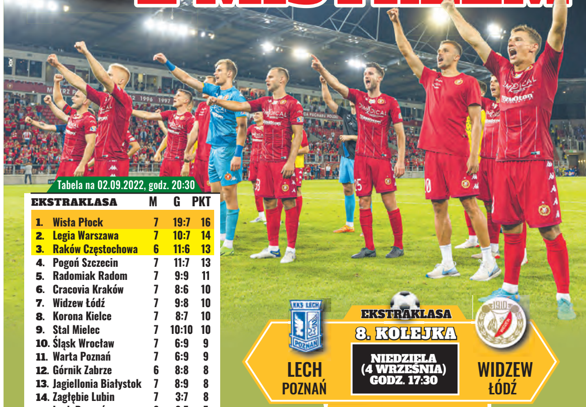
Tabela na 02.09.2022, godz. 20:30