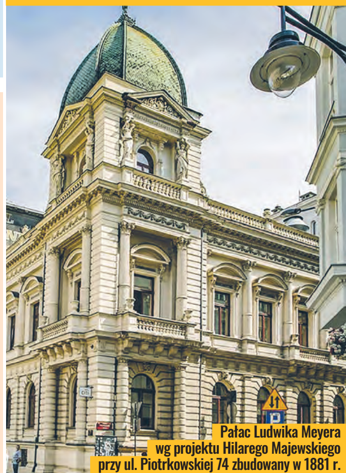
Pałac Ludwika Meyera wg projektu Hilarego Majewskiego przy ul. Piotrkowskiej 74 zbudowany w 1881 r.