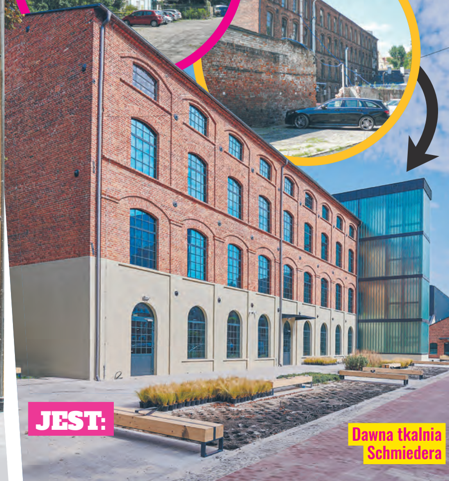
Dawna tkalnia Schmiedera