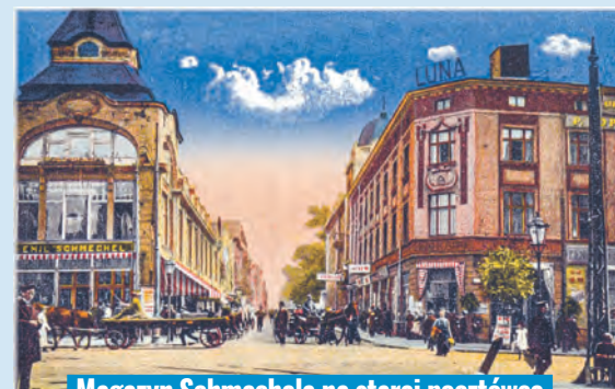
Magazyn Schmechela na starej pocztcówce

nowego otwarcia oraz ogłoszenia o możliwości wynajmu stoisk? Może magazyn Schmechela i Dom Buta odżyje raz