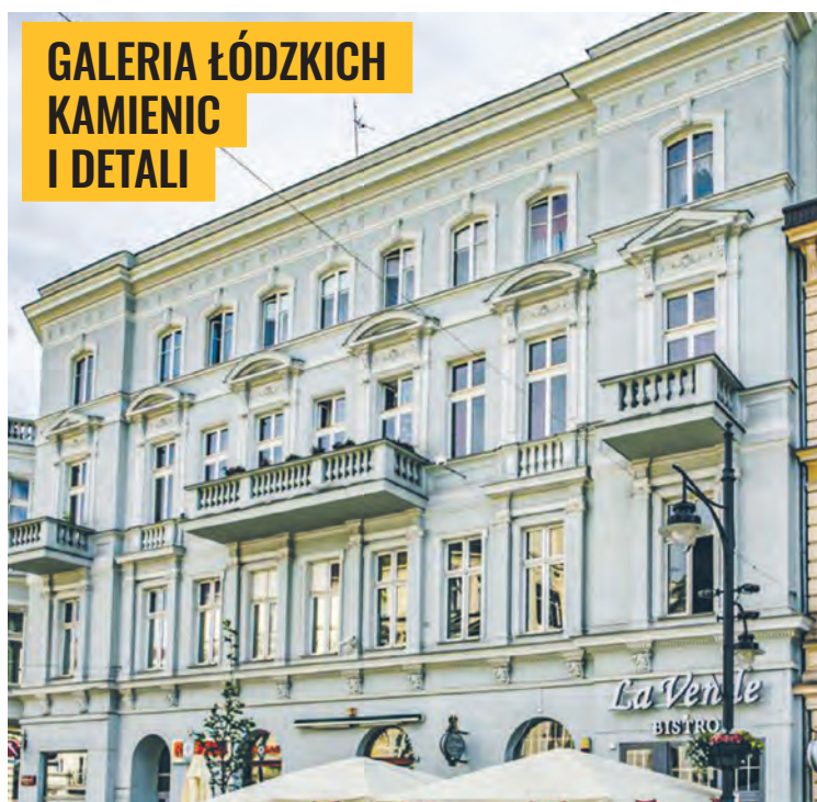
Kamienica Moszka Działowskiego przy ul. Piotrkowskiej 76 zbudowana w 1882 r. wg projektu Hilarego Majewskiego