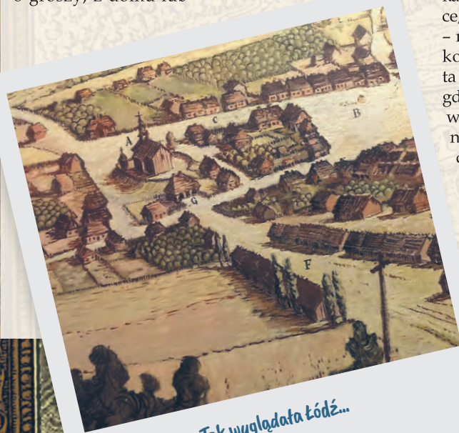
Tak wyglądała Łódź...