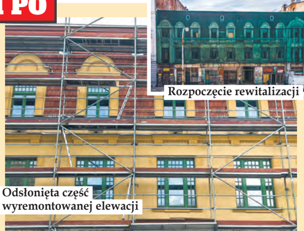
Odsłonięta część wyremontowanej elewacji

dach. Wykonawca wymienił instalacje i podłączył kamienicę do centralnego ogrzewania. Budynki są ocieplone, fundamenty zaizolowane, a wnętrza przebudowane tak, aby powstały tam komfortowe warunki do mieszkania i prowadzenia działalności gospodarczej. Wewnątrz powstanie 41 mieszkań komunalnych, świetlica środowiskowa oraz dwa lokale użytkowe. Przed wykonawcą ostatnia prosta. W kamienicy