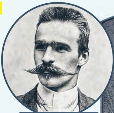
Józef Piłsudski z czasów pobytu w Łodzi i tablica pamiątkowa z ul. Wschodniej 19