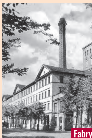
Fabryka Gejera z okresu okupacji

w złote rubelki. I tak było do połowy XIX w., ale rozdająca się gospodarka kapitalistyczna niosła również