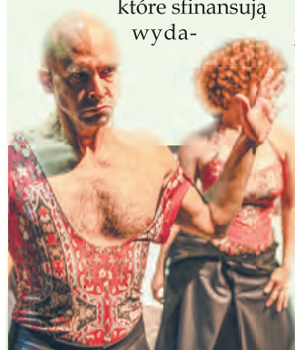
Próba medialna spektaklu „Ragnarok”