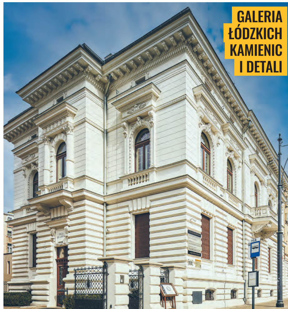
Neorenesansowy pałac Gustawa Schreera przy ul. Narutowicza 48 powstał w latach 1893–1894 wg projektu Gustawa Landaua-Gutentegera