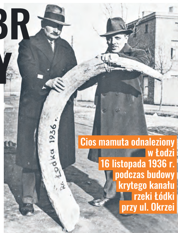
Cios mamuta odnaleziony w Łodzi 16 listopada 1936 r. podczas budowy krytego kanału rzeki Łódki przy ul. Okrzei

W muzeum znalazła się też czaszka nosorożca włochatego, wykopana w 1925 r. na głębokości 4,5 m w trakcie robót kanalizacyjnych. Wydobyto ją z dna rzeki Karolewki w okolicach ul. Obywatelskiej podczas budowy pierwszego kolektora ściekowego w Łodzi. W zasobach muzeum jest też poroże losia, znalezione wiosną 1925 r. podczas prac w korycie rzeki Łódki. Wśród ekspozycji można znaleźć także cios mamuta, odkryty w 1926 r. na głębokości 5 m przy budowie