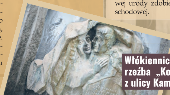
Włókiennicza 2 rzeźba „Kochankowie z ulicy Kamiennej”