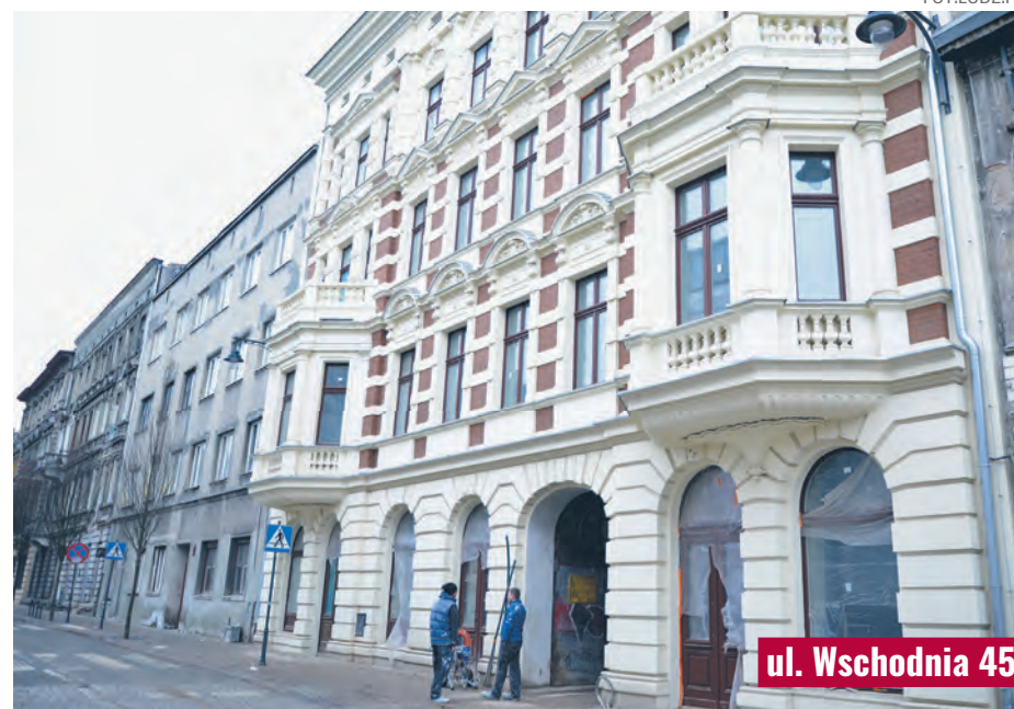
ul. Wschodnia 45

W kompleksie budynków przy ul. Wschodniej 35 prowadzone są