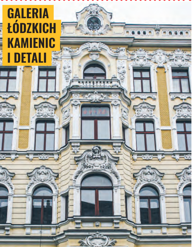
Neobarokowa kamienica Teodora Steigerta przy ul. Piotrkowskiej 90 zbudowana w 1895 r. wg projektu Franciszka Chełmińskiego