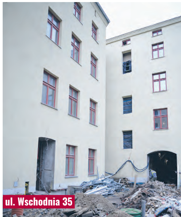
ul. Wschodnia 35

– Jako pierwszą do użytkowania oddamy kamienicę pod numerem 45. Planujemy, że w wakacje zakoń-