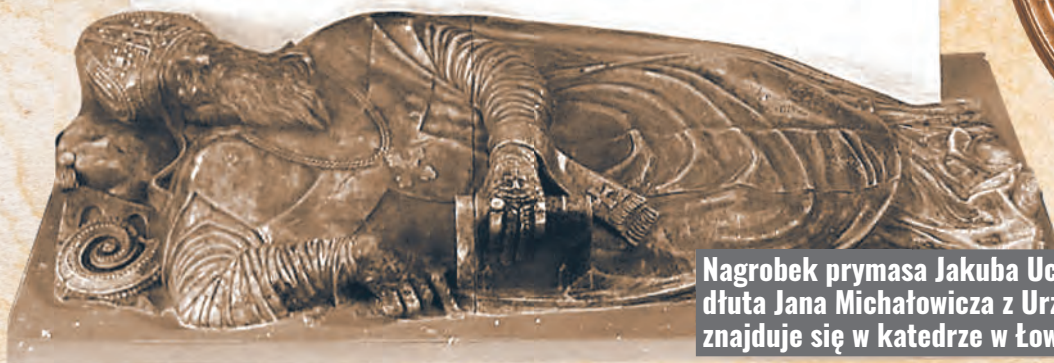
Nagrobek prymasa Jakuba Uchańskiego dłuta Jana Michałowicza z Urzędowa znajduje się w katedrze w Łowiczu