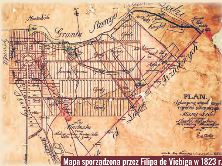
Mapa sporządzona przez Filipa de Viebiga w 1823 r.

z północy na południe, biegł trakt piotrkowski. Grunty rządowe po wschodniej stronie zajęto na osadę, a ziemie po zachodniej stronie stanowiły własność mieszczan Starego Miasta. Łódź w swym rozwoju posuwała się w kierunku południowym, trzymając się dawnej arterii komunikacyjnej. W latach 1824-1828 na południe od Nowego Miasta utworzono drugą osadę przemysłową – Łódkę, przeznaczoną dla tkaczy bawełny i lnu, a regulacja miasta w latach 1821-1828 wytyczyła główne zarysy terytorialne dzisiejszej Łodzi.