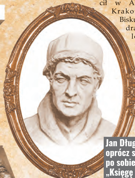
Jan Długosz (1415–1480) oprócz sławnej kroniki pozostawił po sobie wiele innych dzieł, w tym „Księgę uposażeń archidiecezji krakowskiej”, w której wymieniono m.in. dobra pabianickie