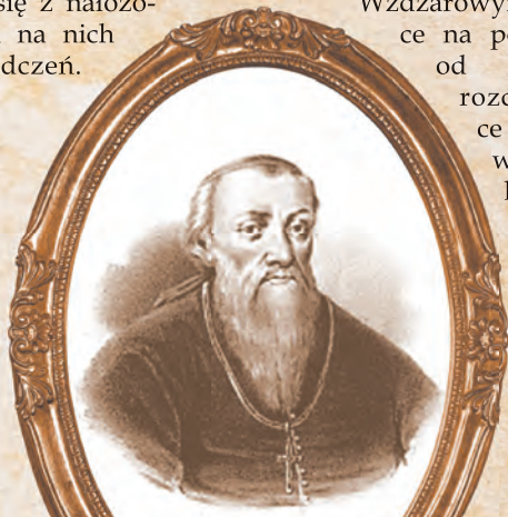
Jakub Uchański (1502–1581) – biskup włocławski mianowany w 1562 r. prymasem Polski, stronnik królowej Bony, przychylny reformacji, bliski koncepcji utworzenia kościoła narodowego, pierwszy interrex Polski