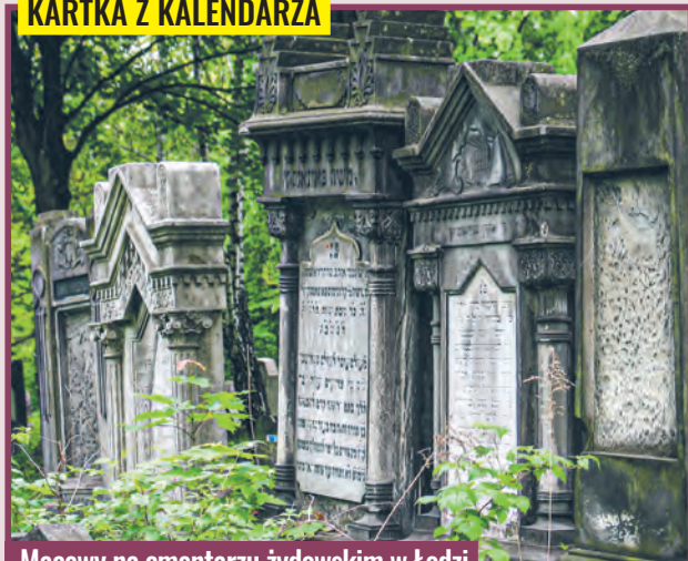
Macewy na cmentarzu żydowskim w Łodzi

10 listopada 1892 r. w rejonie ulic Brackiej, Zagajnikowej, Kaufmana, Inflanckiej i Zmiennej, na części terenu ofiarowanego gminie przez Izraela K. Poznańskiego, otwarto tzw. Nowy Cmentarz Żydowski.