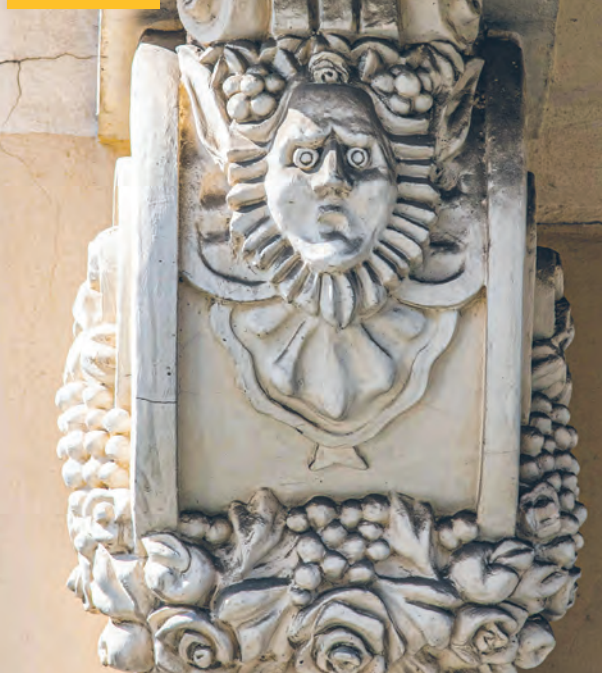
Detal architektoniczny eklektycznej kamienicy Jakuba Hoffmana przy ul. Piotrkowskiej 101, zbudowanej pod koniec XIX w. według projektu Edwarda Creutzburga z 1880 r.