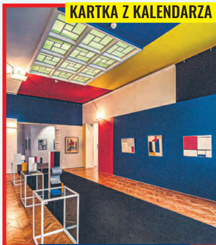
Sala Neoplastyczna w MS

zbiorów o dzieła polskiej sztuki nowoczesnej. Pod obecną nazwą Muzeum Sztuki w Łodzi zaczęło działać w 1950 r. agr