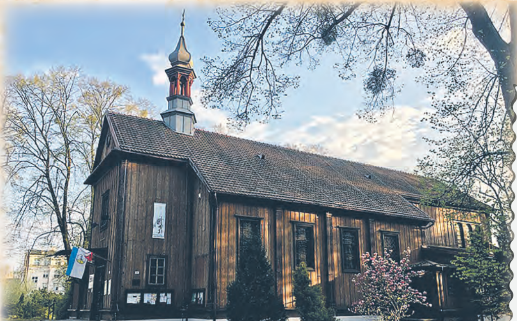
Kościół św. Józefa przy ul. Ogrodowej (przeniesiony z pl. Kościelny w 1888 r.)