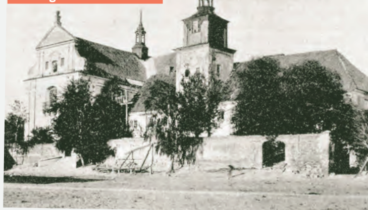
Klasztor w Łagiewnikach na fotografii z końca XIX w.