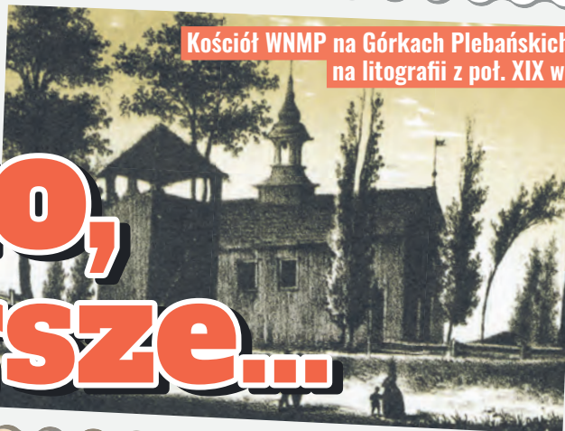
Kościół WNMP na Górkach Plebańskich na litografii z poł. XIX w.

Swoistym fenomenem w dziejach Łodzi jest fakt, że choć uzyskała ona prawa miejskie 600 lat temu, to najstarsze zachowane artefakty na terenie obecnej aglomeracji czy nawet historyczne ślady pochodzą z XVII/XVIII w.