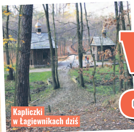
Kapliczki w Łagiewnikach dziś