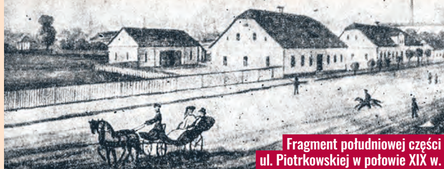
Fragment południowej części ul. Piotrkowskiej w połowie XIX w.