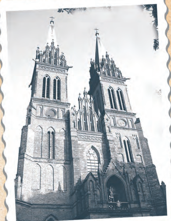
Po ponad 400-letnim władaniu Łodzią przez biskupów kujawskich, w czasach II zaboru pruskiego, stała się ona własnością rządową w 1806 r. (na zdjęciu katedra we Włocławku)

W ostatnich latach pruskiego panowania z inicjatywy mieszkańców i władz podjęto starania o zorganizowanie szkoły, a ten skarżył się u władz. Zatarg się zaostrzał i ostatecznie z braku składek szkoła przestała funkcjonować. Tradycje pierwszej łódzkiej szkoły z 1808 r. kontynuuje jednak SP nr 1 im. A. Mickiewicza przy ul. Sterlinga.