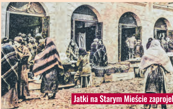
Jatki na Starym Mieście zaprojektowane przez H. Marconiego

że południowego odcinka ul. Piotrkowskiej skarżyli się jednak, że muszą odbywać zbyt daleką drogę, by kupić w jatkach mięso i pieczywo. Miasto wybudowało więc w 1841 r. jatki przy ul. Nowomiejskiej, naprzeciw Rynku Starego Miasta, które zaprojektował słynny architekt, Henryk Marconi. Ten zabytek dawnej Łodzi został wyburzony po drugiej wojnie światowej. Trzecie jatki rzeźniczo-piekarskie urządzono w 1843 r. na Rynku Fabrycznym (dziś pl. Katedralny), po prawej stronie, w pobliżu ul. Piotrkowskiej. agr