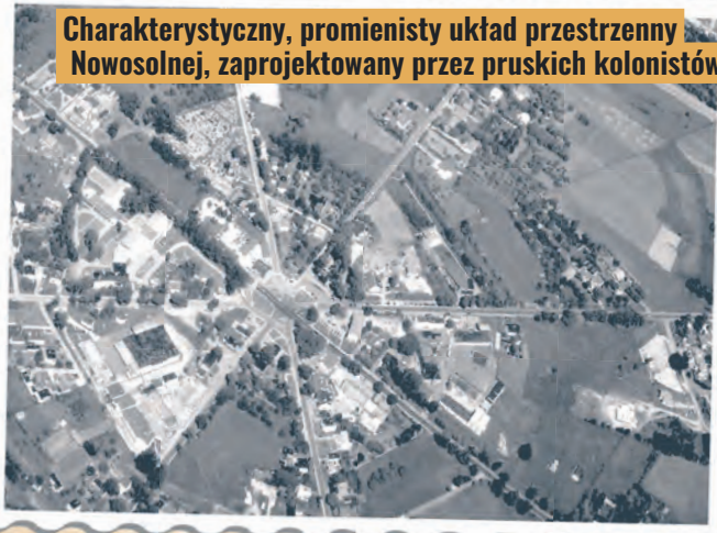
Charakterystyczny, promienisty układ przestrzenny Nowosolnej, zaprojektowany przez pruskich kolonistów

Stoki, Mileszki, Bedoń czy Chojny, chętnie sprzedawali zarosłe lasami posiadła, a puste okolice Łodzi zmieniły się w dobrze zagospodarowane wsie. Tak powstała np. wieś Nowosolna, rozwinął się Konstanyńów, a niemieccy tkacze osiedlili się w Zgierzu i Ozorkowie. Głównym punktem