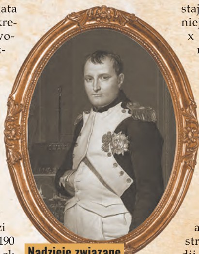
Nadzieje związane z utworzeniem przez Napoleona Księstwa Warszawskiego i odrodzenia państwa polskiego okazały się niestety krótkotrwałe