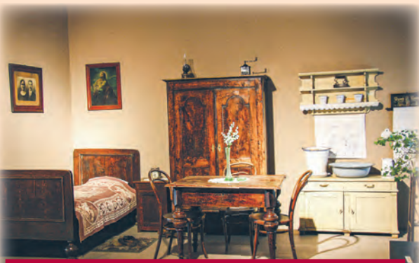
Rekonstrukcja XIX-wiecznej izby robotniczej w Łodzi

Detal architektoniczny kamienicy Bernarda Gliuksmana przy ul. Struga 7 i al. Kościuszki 36, zbudowanej w 1895 r. według projektu Dawida Landego