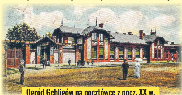
Ogród Gehligów na pocztówce z pocz. XX w.