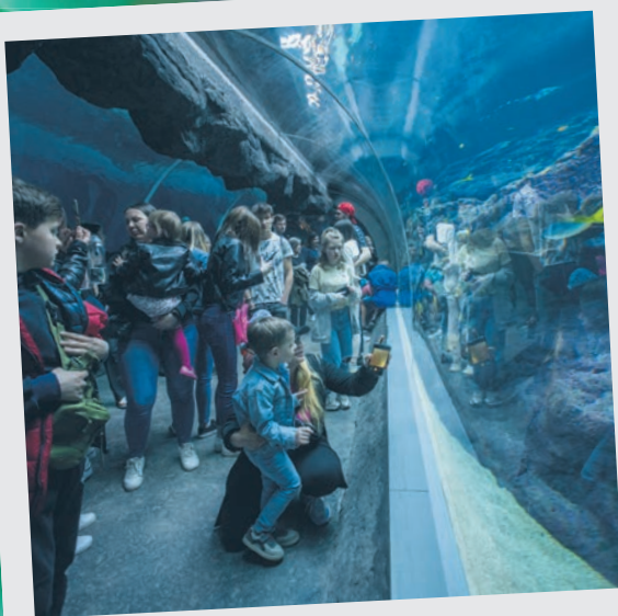
Nocne zwiedzanie Orientarium