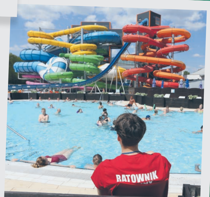
Otwarcie basenów na Fali