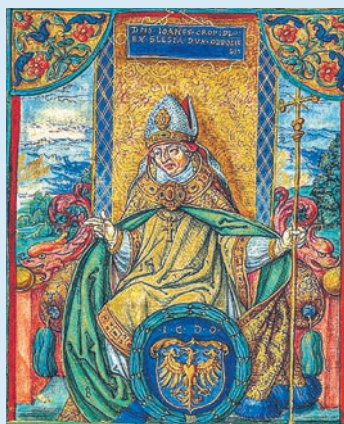
Biskup włocławski Jan Kropidło

o pierwszą lokację Łodzi (nazwanej wtedy Ostrogą, ale nazwa się nie utrzymała), tyle że był to przywilej nadany przez właściciela miasta.