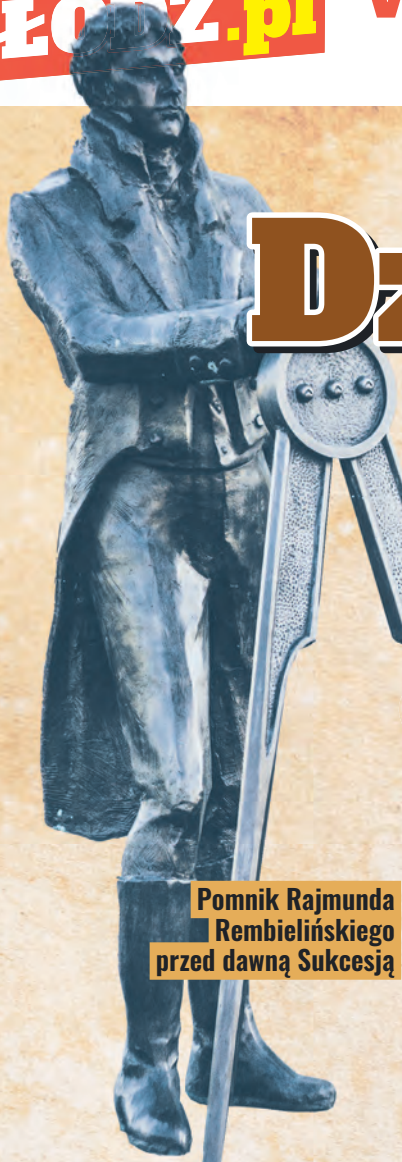
Pomnik Rajmunda RembIELIŃSKIEGO przed dawną Sukcesją