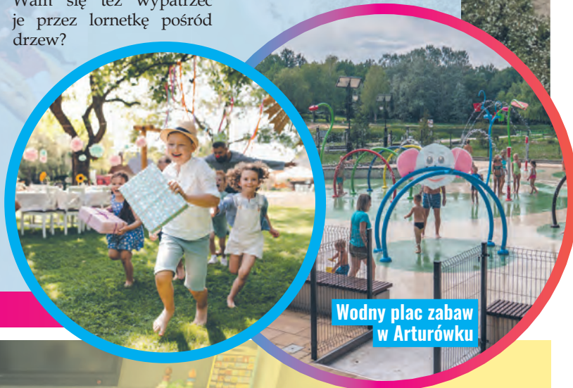
Wodny plac zabaw w Arturówku