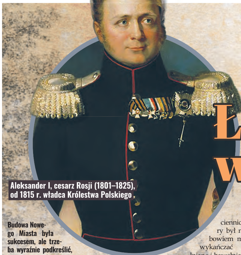
Aleksander I, cesarz Rosji (1801–1825), od 1815 r. władca Królestwa Polskiego