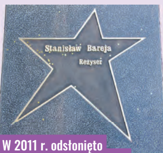
W 2011 r. odsłonięto gwiazdę Stanisława Barei na ul. Piotrkowskiej

epizodyczne role i kręcił krótkie filmiki reklamowe. W 1958 r. przedstawił jako film dyplomowy etiudę pod tytułem „Gorejące czapki”, ale obraz ten nie został przyjęty z przyczyn ideolo-