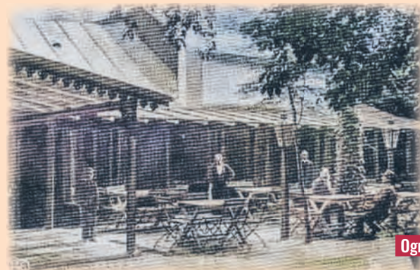
Ogród w zajęzdzie Paradyż