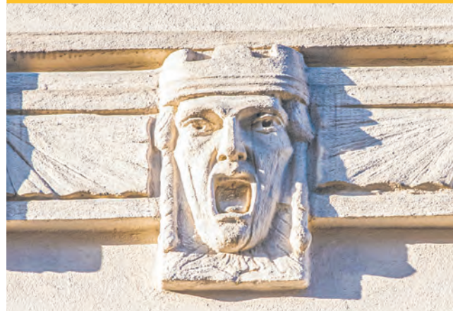
Detal architektoniczny na fasadzie kamienicy przy ul. 6 Sierpnia 1/3