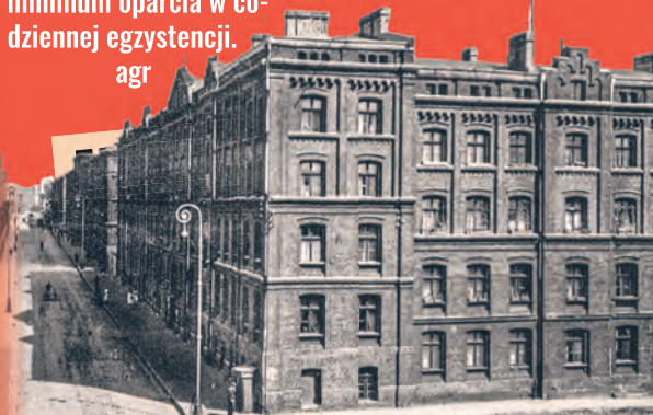
Domy fabryczne Poznańskiego przy ul. Ogrodowej