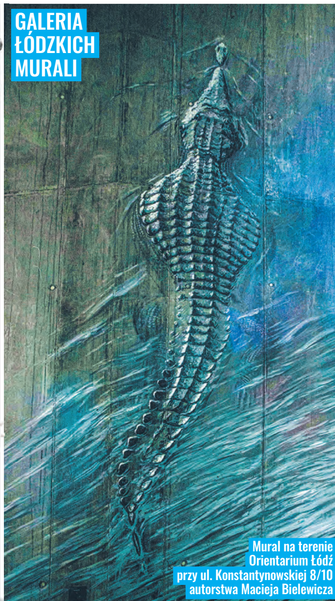
Mural na terenie Orientarium Łódź przy ul. Konstantynowskiej 8/10 autorstwa Macieja Bielewicza