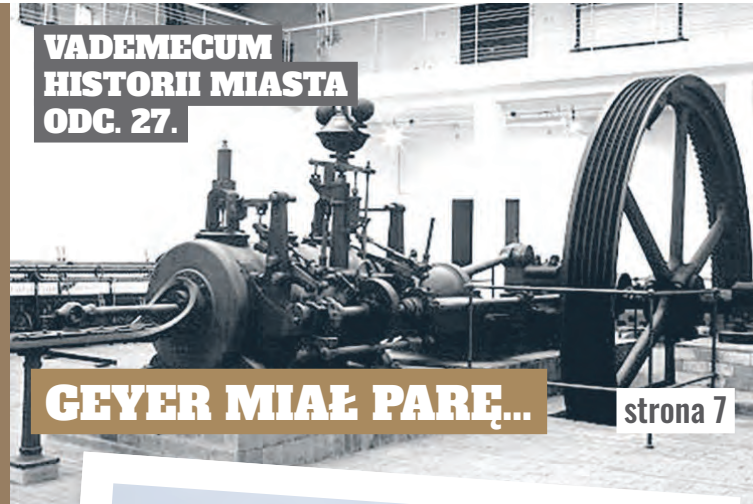
VADEMECUM HISTORII MIASTA ODC. 27.

DLA SENIORA | DLA RODZINY | DLA KOCHAJĄCYCH ŁÓDŹ