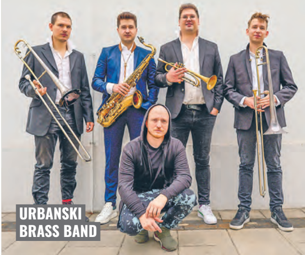
URBANSKI BRASS BAND