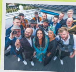
Kayah & Bum Bum Orkest & Fisbanda.

werowy, dostępny w godz. 12:00-24:00. Rowery będzie można pozostawić w wyznaczonym miejscu, między wejściem do galerii handlowej (w pobliżu sklepu Van Graaf) a muzeum MS2. Parking będzie dozorowany przez ochroniarzy, którzy będą też koordynować jego funkcjonowanie. Obowiązkowo należy mieć swoje zapieczę. red