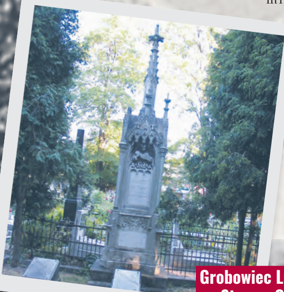
Grobowiec Ludwika Geyera na Starym Cmentarzu