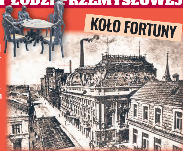
Pałac Poznański jako siedziba Urzędu Wojewódzkiego

Mimo kilku wystawnych pałaców nie udało się Poznańskiemu prześcignąć Scheiblera. W roku swojej śmierci dysponował wprawdzie olbrzymim majątkiem, wynoszącym ponad 7 mln czy może 10 mln rubli, ale stanowiło to jednak 80% wartości majątku jego wielkiego konkurenta. Dyrektorem generalnym spółki został najstarszy syn – Ignacy. Zakłady nie osiągnęły szczytu swego rozwoju. Produkcja rosła, a zatrudnienie przekroczyło 7000 osób. Przed wybuchem I wojny światowej majątek Poznańskich szacowano na blisko 30 mln rubli, ale kolejne lata przyniosły przedsiębiorstwu duże straty. W czasach II RP firmą nadal zarządzała rodzina, ale zadłużone kredytem przedsiębiorstwo przejął Banca Commerciale Italiana. Z kolei pałac przy ul. Ogrodowej w latach 1927–1939 stał się siedzibą władz województwa. agr