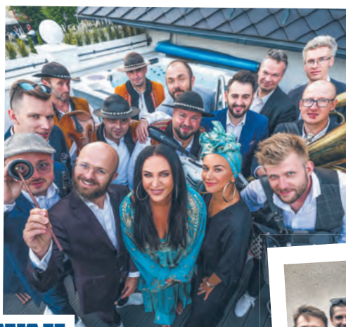
KAYAH & BUM BUM ORKESTAR & FIŚBANDA