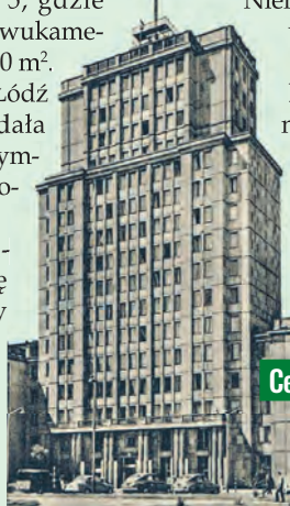
Wieżowiec Centrali Tekstylnej (obecnie TVP) na pocztówce z lat 50. XX w.