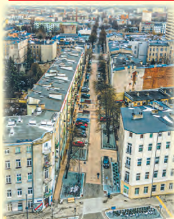
Ul. 28. Pułku Strzelców Kaniowskich jest dziś woonerfem

w nowych warunkach politycznych czy społecznych.