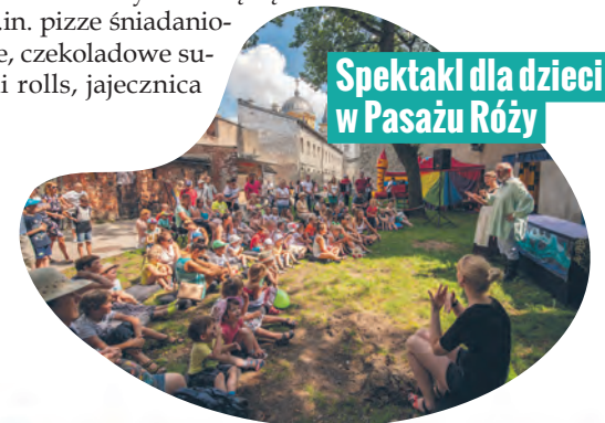
Spektakl dla dzieci w Pasażu Róży