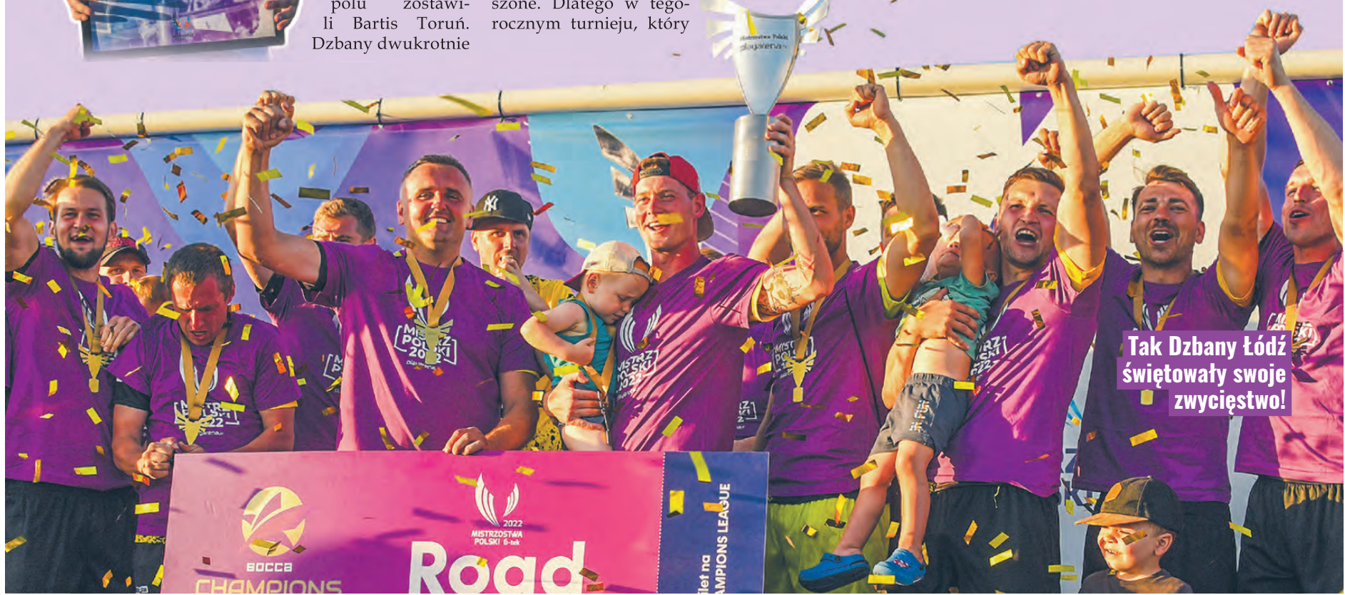
Tak Dzbany Łódź świętowały swoje zwycięstwo!