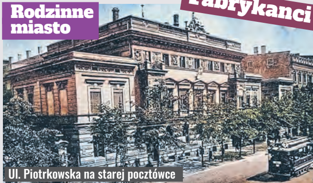
Ul. Piotrkowska na starej pocztowce

Artykuł o Łodzi napisany przez pana Juliana w latach 30. XX w. dla „Wiadomości Literackich”, nie jest – jak widać – sentymentalną laurką, a momentami bywa bardzo krytyczny, co dodaje mu prawdziwości. Tak Tuwim pisał np. o łódzkich fabrykantach: