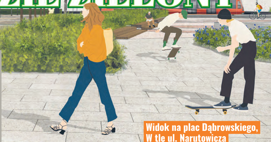
Widok na plac Dąbrowskiego, w tle ul. Narutowicza

– Nasza propozycja to szkic, który pokazuje kierunek, którym chcemy podążać. Ta koncepcja to zaproszenie do dyskusji i wstęp do rozmów. Nie przesadzamy tutaj ja-