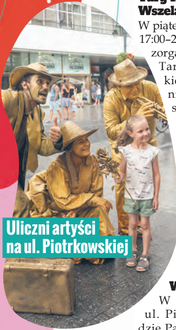
Uliczni artyści na ul. Piotrkowskiej