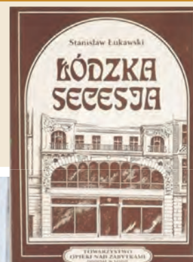
Okładka książki S. Łukawskiego