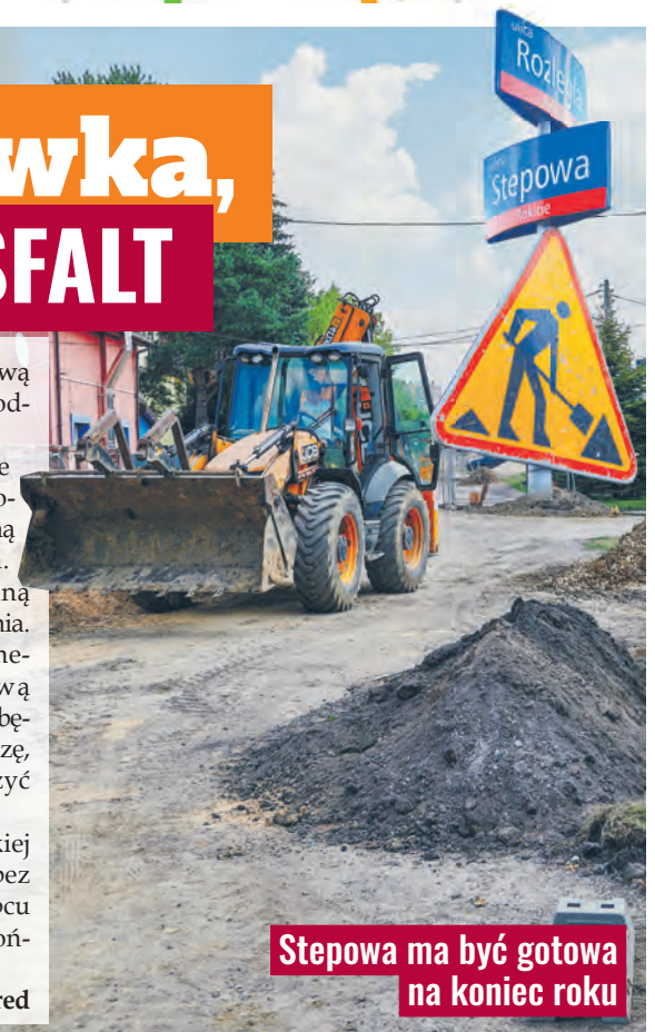
Stepowa ma być gotowa na koniec roku