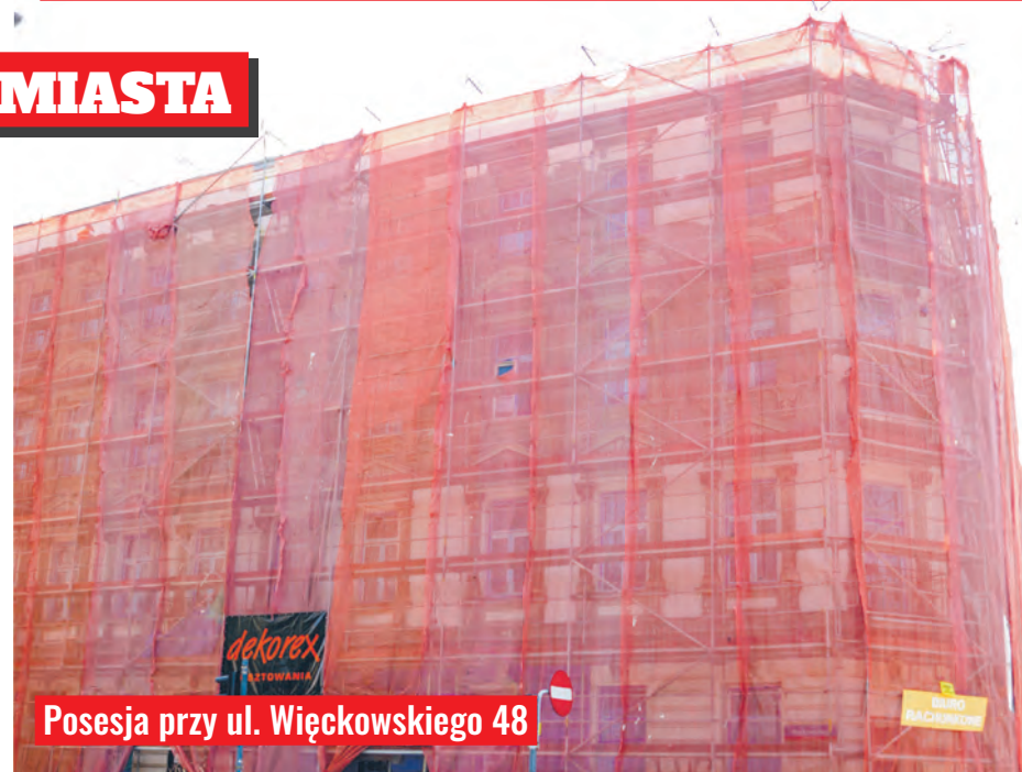
Posesja przy ul. Więckowskiego 48

miasto są przede wszystkim remonty i renowacje fasad frontowych, elewacji widocznych dla przejazdów lub przejazdów bramowych wiodących na ogólnodostępne podwórza – części budynków na widoku publicznym. Preferowanie takich remontów ma swoje uzasadnienie, bowiem ich wykonanie zdecydowanie poprawia estetykę miasta, którą większość mieszkańców oraz przyjezdnych ocenia