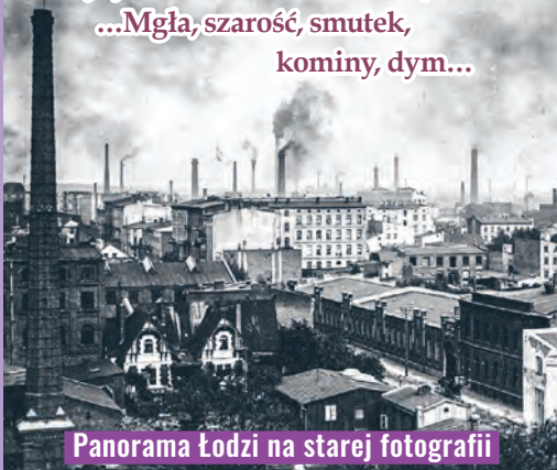
Panorama Łodzi na starej fotografii