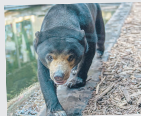
Niedźwiedzie malajskie doskonale czują się w łodzi

Jedne w Polsce niedźwiedzie malajskie można zobaczyć w Orientarium Zoo Łódź! Samiec o imieniu Somnang to osobnik z wyjątkową historią. Urodził się w 2002 r., na wolności. Padł ofiarą nielegalnego handlu zwierzętami. Odebrany przez Free the Bears Fund prywatnemu właścicielowi, który trzymał go w ciasnej klatce, zamieszkał w ogrodzie zoologicznym w Edynburgu. Obecnie można spotkać go w Orientarium.