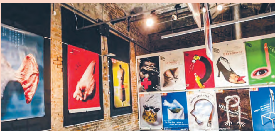
Wystawa plakatów Michała Batorego w Muzeum Fabryki w Manufakturze w Łodzi w 2020 r.

Unikatowy styl Michała Batorego jest rozpoznawalną światową marką, a sam artysta miał dużą wystawę w rodzinnym mieście w Centralnym Muzeum Włókiennictwa w 2012 r. oraz w kilku galeriach łódzkich w 2020 r. Ta ostatnia wypadła akurat w czasie pandemii i miała niestety nieco ograniczony zasięg. W każdym razie mamy w gronie znanych łódzian wybitnego grafika światowego formatu. agr