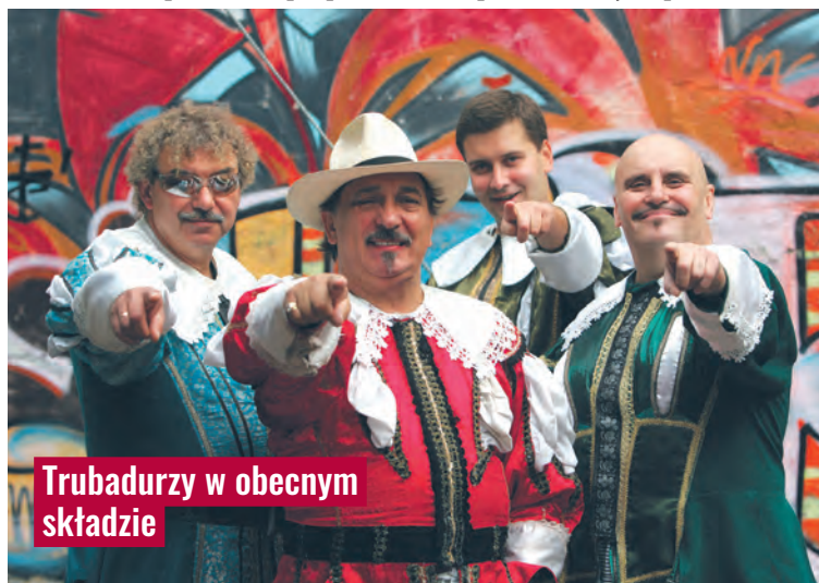
Trubadurzy w obecnym składzie