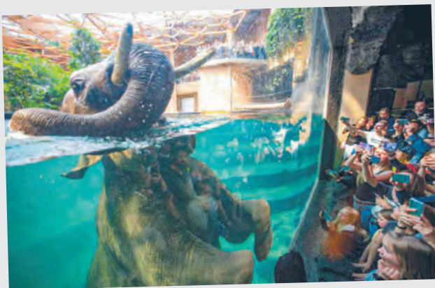
Taru w kąpielu