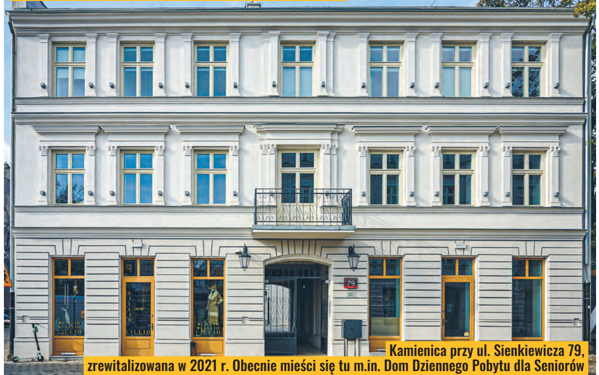
Kamienica przy ul. Sienkiewicza 79, zrewitalizowana w 2021 r. Obecnie mieści się tu m.in. Dom Dziennego Pobytu dla Seniorów