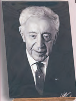
Portret A. Rubinsteina w Muzeum Miasta Łodzi

W sobotę przypada dzień urodzin Artura Rubinsteina, który przyszedł na świat 28 stycznia 1887 r. w Łodzi. Zbliżamy się do zakończenia cyklu spotkań z wielkim wirtuozem i pianistą, a data ta spina kłamarą ubiegły, jubileuszowy rok, w którym obchodziliśmy 135. urodziny oraz 40. rocznicę śmierci artysty. Przez kilka miesięcy przybliżaliśmy sylwetkę muzyka,