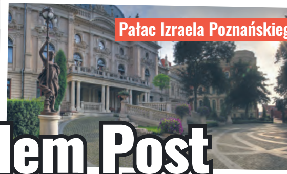
Pałac Izraela Poznańskiego