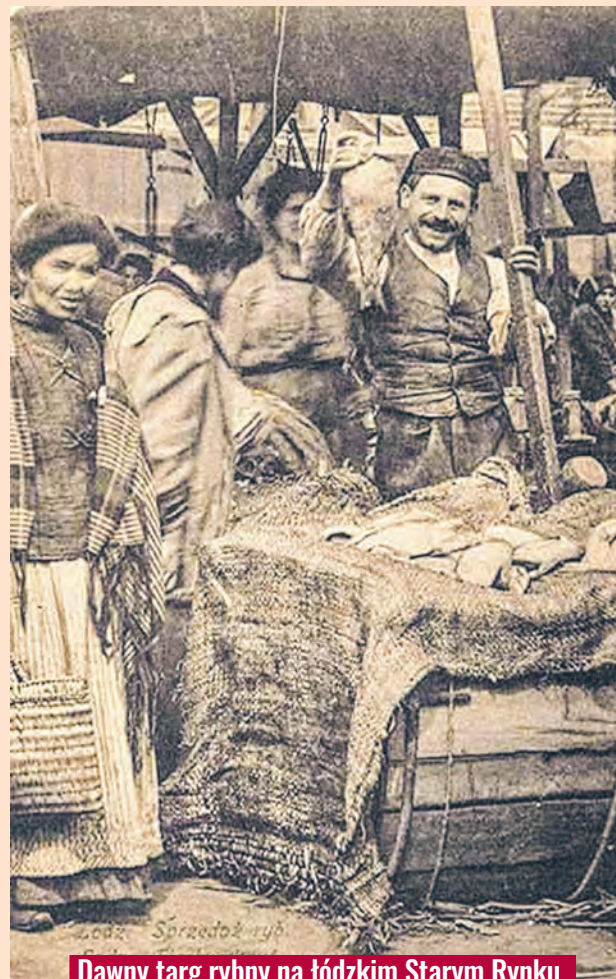
Dawny targ rybny na łódzkim Starym Rynku