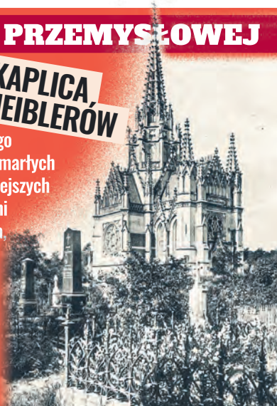
Kaplica na fotografii B. Wilkoszewskiego z końca XIX w.