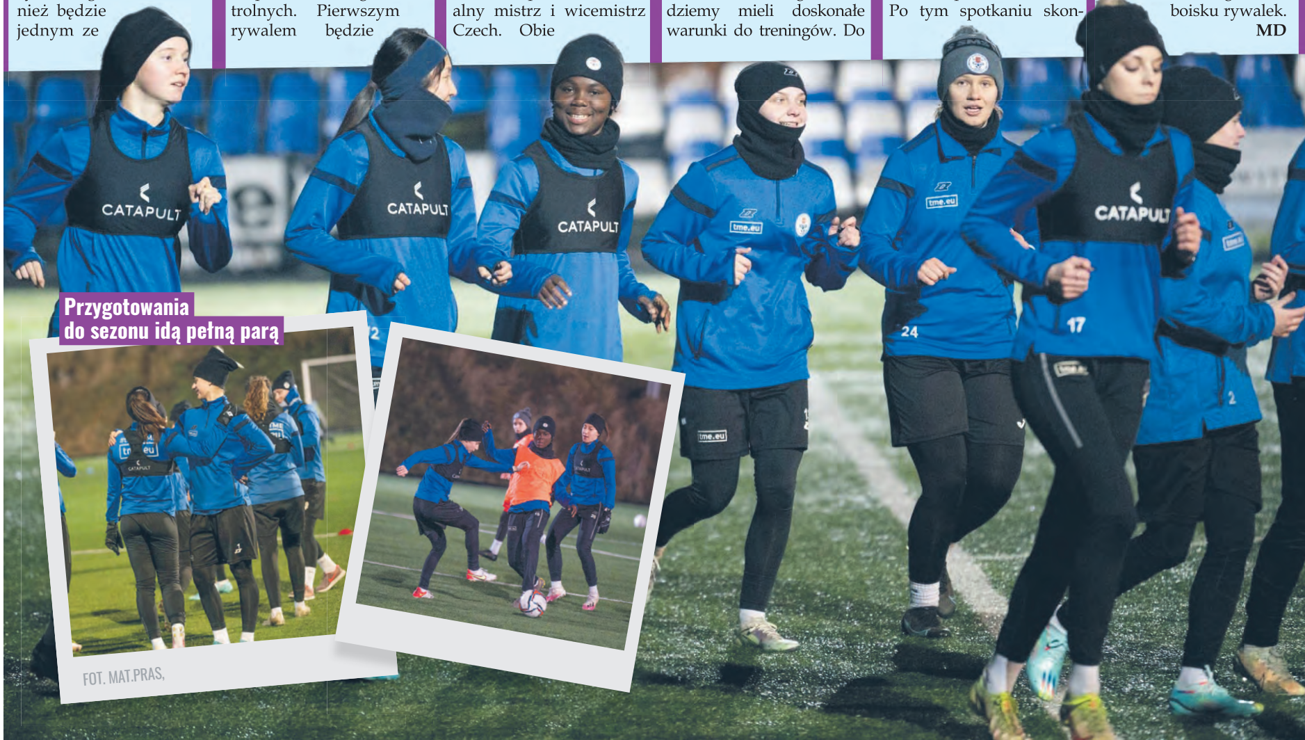
Przygotowania do sezonu idą pełną parą