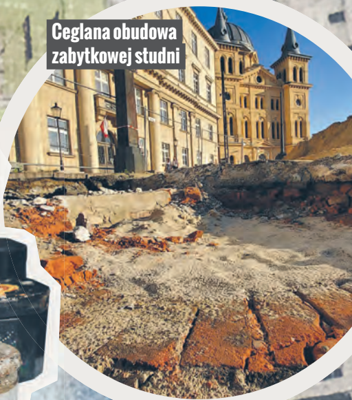
Ceglana obudowa zabytkowej studni

jów miasta ukazują się, kiedy drogowcy zrywają starą nawierzchnię ulicy albo gdy ekipa budowlana ściąga ze ściany kolejne warstwy farby.