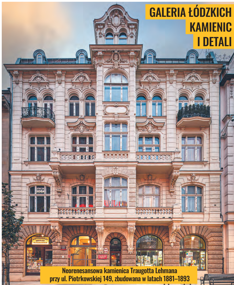
Neorenesansowa kamienica Traugotta Lehmana przy ul. Piotrkowskiej 149, zbudowana w latach 1881–1893