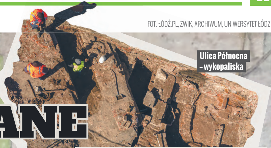
Ulica Północna – wykopiska

ale zwyczajne, miejskie ulice, wzdłuż których po obu stronach stały kamienice i fabryki. Najlepiej zachowane fundamenty odsłonięto przy dawnym skrzyżowaniu ul. Północnej i ul. Wolborskiej. Ta druga ulica przed wojną kończyła się właśnie na Północnej. Na rogu stała wtedy apretura i farbiarnia braci Cytryn.