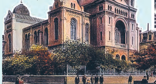
Wielka Synagoga na starej pocztówce i zdjęcie wnętrza

Podobnie jak inne synagogi łódzkie i ta została podpalona przez Niemców w nocy z 10 na 11 listopada 1939 r., budowlę rozebrano w 1940 r. Po wojnie nie została odbudowana, a na jej miejscu przez lata znajdował się plac handlowy, parking i postój taksówek. Obecnie na tym terenie trwa budowa stacji kolei podziemnej, a podczas prac odsłonięte zostały fundamenty Wielkiej Synagogi. agr