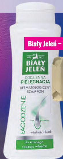
Biały Jeleń – szampon i mydło