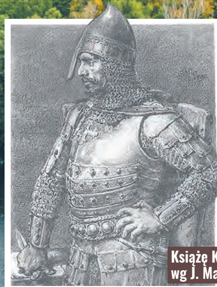
Książę Konrad Mazowiecki wg J. Matejki