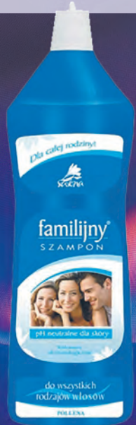
Familijny – szampon do włosów