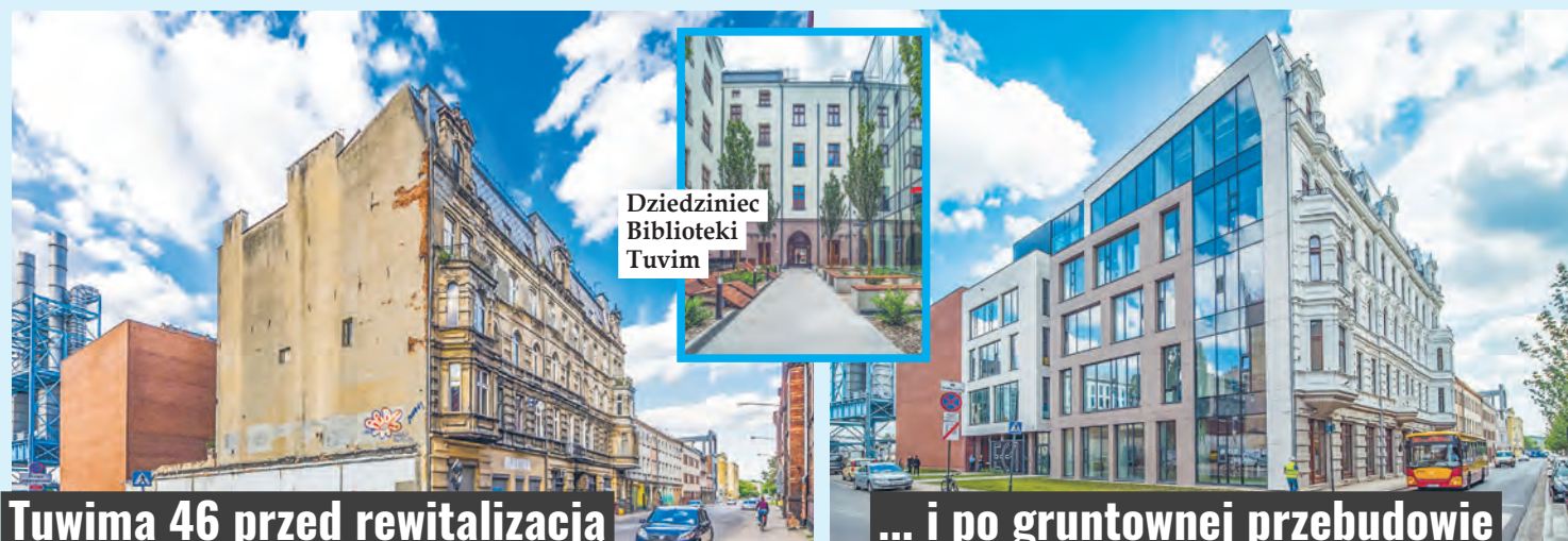
Dziedziniec Biblioteki Tuvim

Remont nie ominął dziedzińca, który stał się jednym z najładniejszych podwórek w centrum miasta. Wykonawca zamienił je w zakątek, gdzie możemy odpocząć wśród zieleni. Mamy zatem i sześć dużych drzew, i mnóstwo krzewów. Pośród nich zostały wybudowane podesty, a na nich stanęły stoliki z krzesłami oraz drewniane leżaki do wylegiwania się w cieplejsze dni. Na ogólnodostępny w godzinach otwarcia biblioteki TUVIM dziedziniec dostaniemy się dwoma wejściami: nową bramą od strony ul. Sass-Zdort oraz bramą historyczną od strony ul. Tuwima. Warto wybrać tę drugą, ponieważ jest dużo ciekawsza. Zdobną ją bowiem odrestaurowane, złożone polichromie, odkryte podczas remontu. Malowidła trafiły w ręce konserwatorów sztuki, którzy pieczołowicie je odrestaurowali.