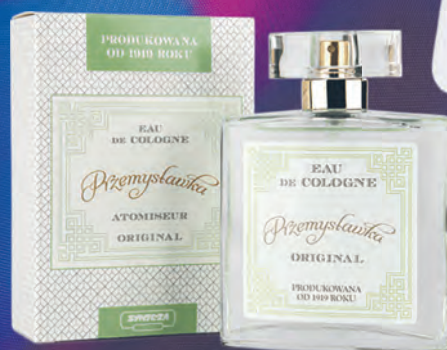
Przemysławka – woda kolońska