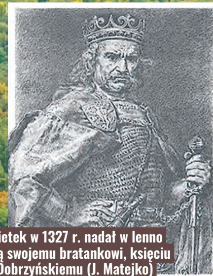
Władysław Łokietek w 1327 r. nadał w lenno ziemię łęczycką swojemu bratankowi, księciu Władysławowi Dobrzyńskiemu (J. Matejko)

Ciekawostką stanowi fakt, że w najstarszych źródłach pisanych, dotyczących terenów dzisiejszej Łodzi, wymieniony jest... Radogoszcz. Książę Konrad Mazowiecki zatwierdził tutaj w 1242 r. ugodę pomiędzy klasztorami sullejowskim i witowskim. Obecność księcia, jego syna Siemowita, dworu oraz przedstawicieli dwóch klasztorów wskazuje, iż odbył się w tej miejscowości jakiś zjazd, a zatem musiała ona osiągnąć już pewien stopień rozwoju, więc można przyjąć, że została założona przed XIII w. Inne wzmianki na planach i mapach wskazywały o istnieniu tutaj fortalicji czy grodu, ale prowadzone w 1964 r. na wzgórku w parku Julianowskim badania archeologiczne nie potwierdziły tych przypuszczeń. agr