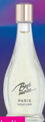
Być może – perfumy damskie