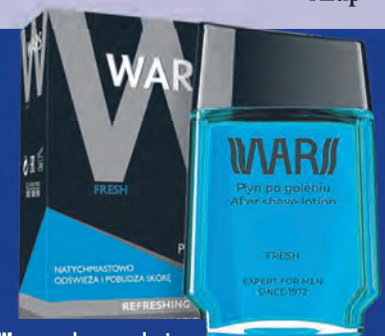
Wars – płyn po goleniu