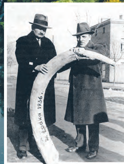
Mamy również ślady paleontologiczne z terenów Łodzi – to np. kieł mamuta znaleziony podczas regulacji rzeki Łódki w 1936 r.