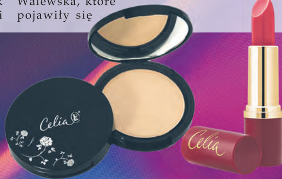
Celia – pomadka i puder prasowany