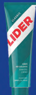
Lider – krem do golenia