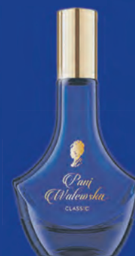
Pani Walewska – perfumy damskie